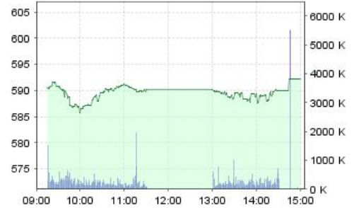
VN-Index: Kết quả giao dịch